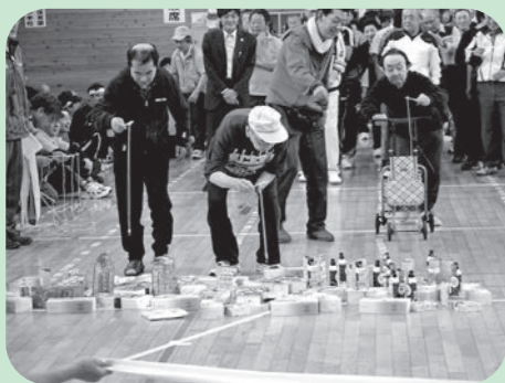
吉祥園の皆さまが 遊びに来てくださいました。