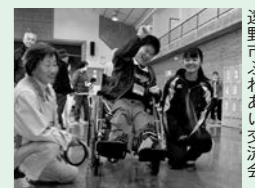
遠野市ふれあい交流会