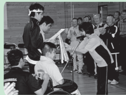
今年の優勝は赤組！