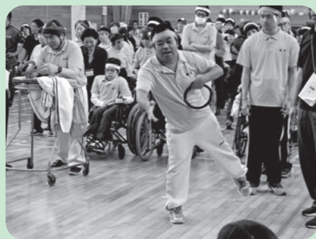
輪投げレースも白熱！