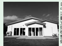
日中活動支援棟整備