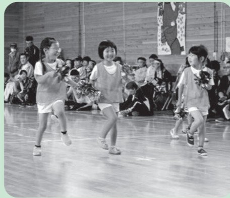
綾織保育園の皆さま 「ほよよん行進曲」