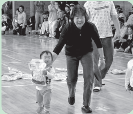
お楽しみレース お菓子を持って頑張りました！

全施設・事業所合同行事になって初めての雨天による屋内での開催となりました。会場の狭さが心配されましたが、近くで観られて一体感があったなどの声もきかれ屋内ならではの良さがあり、盛会裏に終えることができました。