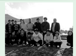
リフレッシュ外出

利用者支援にあつては、精神障がい者を有している方が大半を占めることから、情緒の安定を図るための声かけや体調管理、相談・助言等を行い、個別支援計画を基に安心して利用できる環境と状態に合わせた作業を提供し、日々の支援に努めました。生産活動においては、配食事業と製品加工事業を中心に取り組みました。多賀の里における配食事業の宅配弁当は好評をいただき前年度並みの実績を挙げることはできましたが、製品加工事業においては、単価の下落等から前年度の実績を下回る結果となりました。「結和」においては、JAF会員優待施設契約を取り交わし広報誌等を通じ御食事処の周知に努めた他、産直部門においてもJA花巻遠野地域営農センターの商品を販売することで新たな顧客を得ることができました。