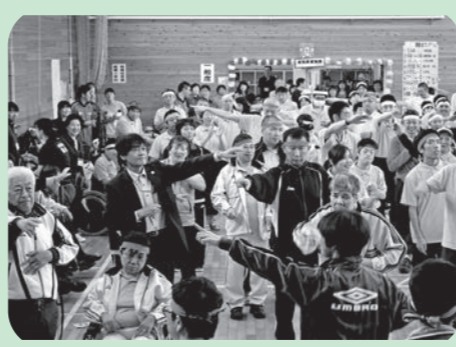
来賓の皆さまもダンスに ご参加くださいました♪