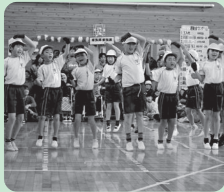
綾織小学校の皆さま 「YMCA」